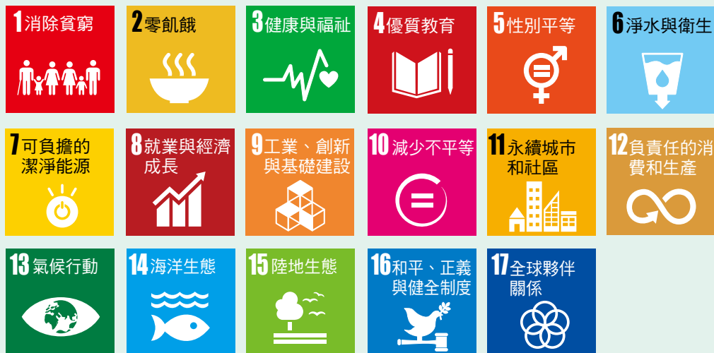
▲ 圖 7-17 聯合國永續發展目標

永續發展的方針，規劃了17項永續發展目標（圖7-17），兼顧「經濟成長」、「社會進步」與「環境保護」三大面向，作為各國政府2030年前努力實現的全球目標。